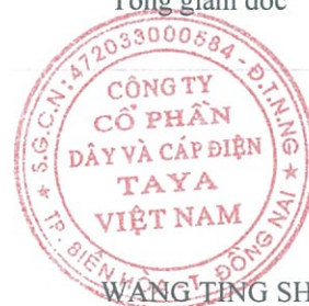
WANG TING SHU